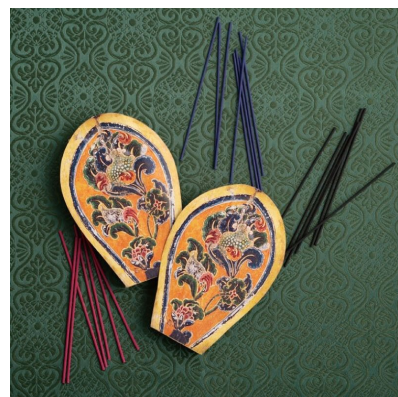
漆金薄絵盤インセンス