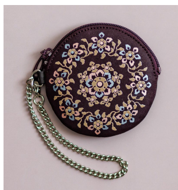
丸型コインパース