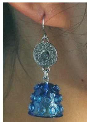
瑠璃坏イヤアクセサリー