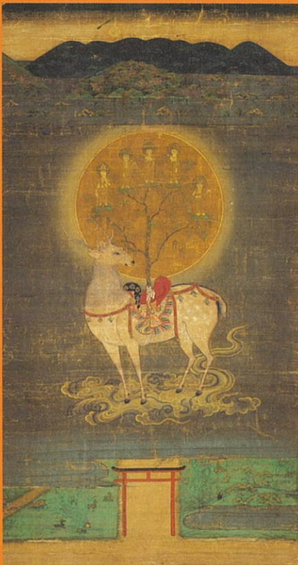
重要文化財 春日鹿曼荼羅(当館)〈展示期間：～12月20日〉