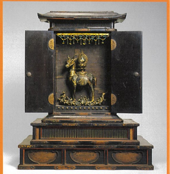
春日神鹿舎利厨子(当館)

春日若宮おん祭は、春日大社の摂社である若宮社の祭礼で、平安時代の保延二年(一一三六)に始まったとされ、今年で八八五年目を迎えます。おん祭では、若宮神が御旅所に一日だけ遷座されますが、そこに芸能者や祭礼の参加者が詣でる風流行列が有名です。 本展覧会はおん祭の歴史と祭礼を紹介し、あわせて春日大社への信仰に関わる美術を紹介する、恒例の企画です。本年は、おん祭を描いた絵画や祭礼にまつわる品々を取り上げると共に、春日信仰の中で数多く生み出された神鹿の美術に焦点を当てます。神々しさと愛らしさを兼ね備えた神鹿の造形をお楽しみください。