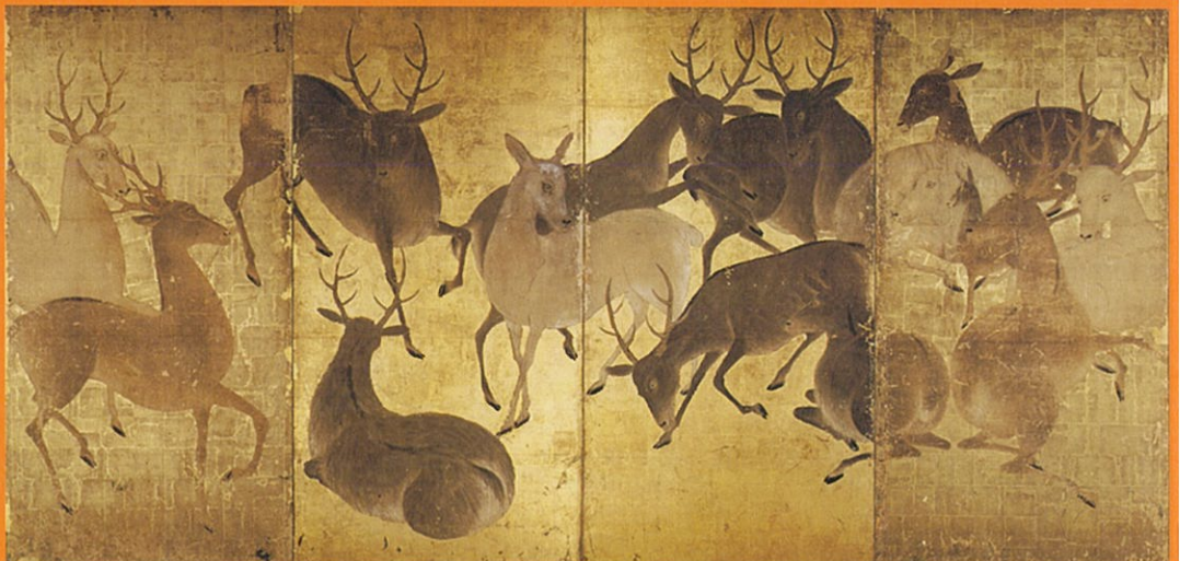
鹿図屏風 左隻 部分(奈良・春日大社)〈展示期間：12月22日～〉