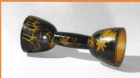
紅葉鹿蒔絵小鼓(奈良・春日大社)

春日若宮おん祭は、春日大社の摂社である若宮社の祭礼で、平安時代の保延二年(一一三六)に始まったとされ、今年で八八五年目を迎えます。おん祭では、若宮神が御旅所に一日だけ遷座されますが、そこに芸能者や祭礼の参加者が詣でる風流行列が有名です。 本展覧会はおん祭の歴史と祭礼を紹介し、あわせて春日大社への信仰に関わる美術を紹介する、恒例の企画です。本年は、おん祭を描いた絵画や祭礼にまつわる品々を取り上げると共に、春日信仰の中で数多く生み出された神鹿の美術に焦点を当てます。神々しさと愛らしさを兼ね備えた神鹿の造形をお楽しみください。