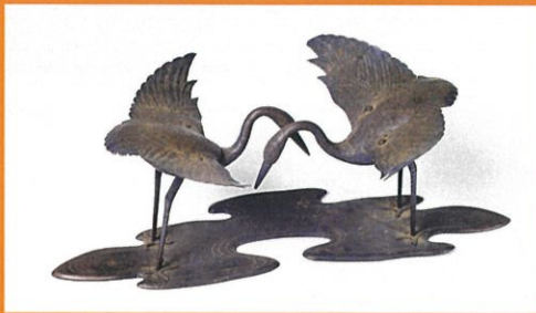
国宝 若宮御料古神宝類 銀鶴及機形(奈良・春日大社)