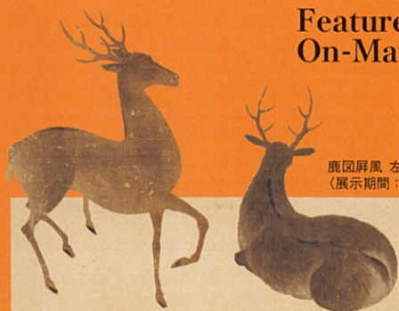
鹿図屏風 左隻 部分(奈良・春日大社) (展示期間：12月22日～)

Feature Exhibition On-Matsuri and the Sacred Art of Kasuga