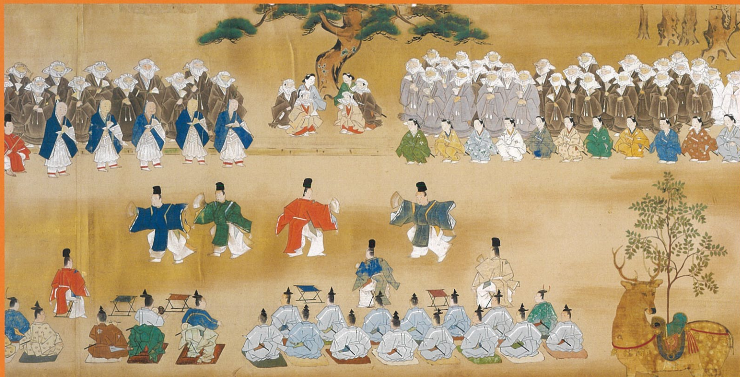
春日鹿曼荼羅 部分 (奈良・西城戸町) (展示期間：12月22日～)