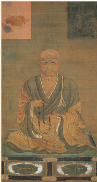
恵心僧都源信像 (聖衆来迎寺) ※前期(7/15～8/6)展示

展示は前期(7月15日～8月6日)、後期(8月8日～9月3日)で絵画と文書を中心に大きな展示替があります。後期には、地獄草紙(国宝、奈良国立博物館所蔵)や餓鬼草紙(国宝、東京国立博物館 ※8月8日～8月20日展示)といった絵巻、山越阿弥陀図(重文、京都・金戒光明寺所蔵)や高野山の阿弥陀聖衆来迎図(国宝、和歌山・有志八幡講 ※8月22日～9月3日展示)といった名品が揃います。ぜひ展示替予定をご確認の上お越しください。