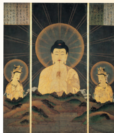
◎山越阿弥陀図 (金戒光明寺) ※後期(8/8～9/3)展示