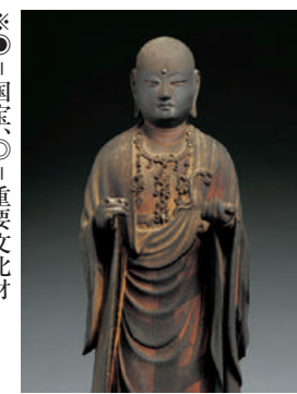
地蔵菩薩立像 当館