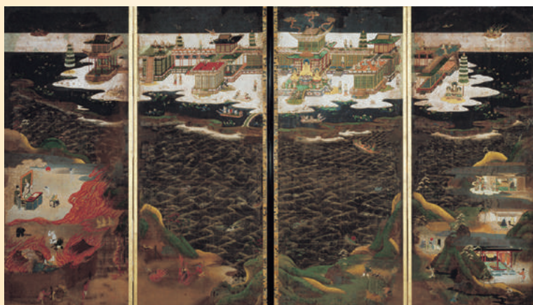
◎地獄極楽図屏風 (金戒光明寺) ※後期(8/8～9/3)展示