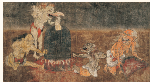
◎地獄草紙[部分] (奈良国立博物館) ※後期(8/8～9/3)展示