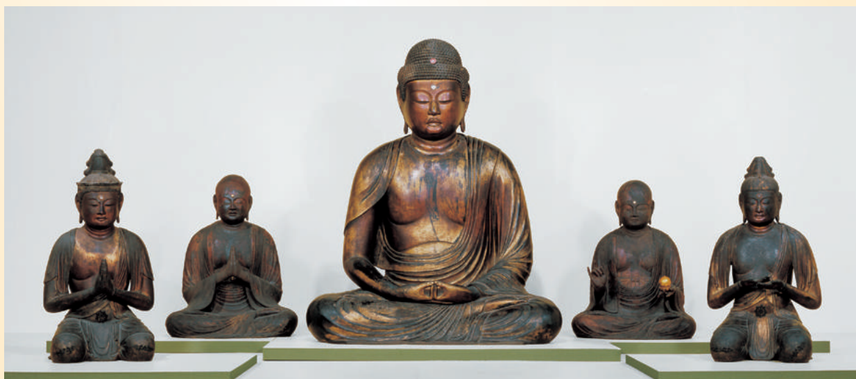
◎阿弥陀如来及び観音・勢至菩薩坐像（保安寺）／地藏・龍樹菩薩坐像（奈良国立博物館）