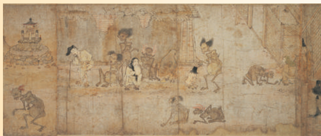
◎餓鬼草紙[部分] (東京国立博物館) ※8/8～8/20展示