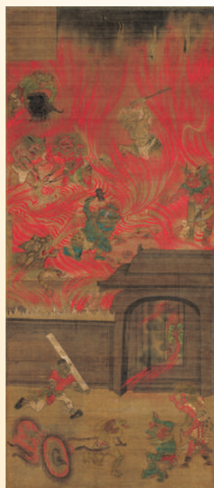
◎六道絵のうち等活地獄・阿鼻地獄（聖衆来迎寺） ※前期(7/15～8/6)全15幅すべて展示