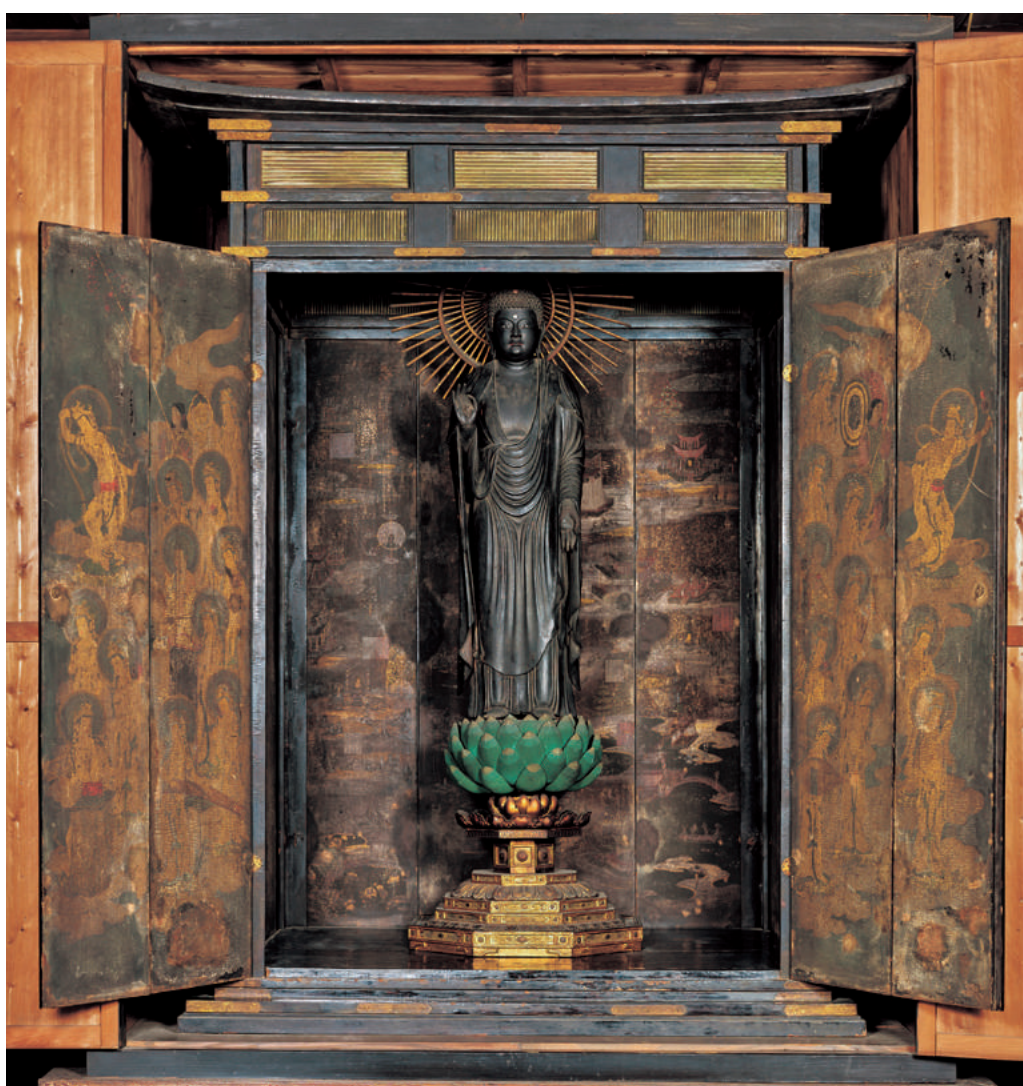
◎阿弥陀如来立像及び厨子（新長谷寺）