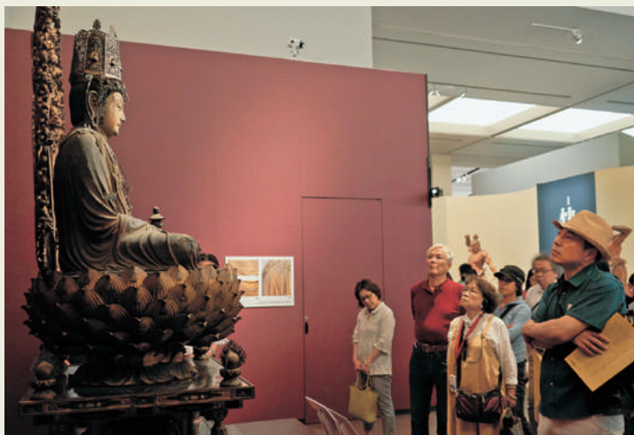
醍醐寺弥勒菩薩像に見入る観覧者

日本の仏像の歴史を概観すると、仏師の名前が知られることは、平安時代以前にはほとんどない。造像に伴い伝えられるのは施主の名前だけである。平安時代後期に康尚と定朝が登場して以降、造像は仏師の名前とともに語られ始めるようになる。当初仏像にとって重要な人間は施主だけだったが、後に仏師の存在が大きくなったのだ。では、そうなったのはなぜなのだろう。快慶は、そうした問題を考える上でもキーとなる仏師である。