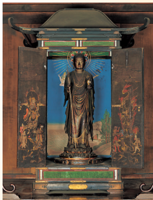
◎地藏菩薩立像及び厨子（東大寺知足院） ※8/1～9/3展示