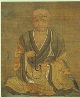
恵心僧都源信像(部分) (法興寺・聖乗来迎寺)