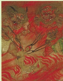
国宝 六道絵のうち阿彌地獄(部分) (法興寺・聖乗来迎寺)

『往生要集』を著し極楽浄土信仰を広めた平安時代の僧・恵心僧都源信。本展ではその足跡をご紹介します。六道絵や阿彌陀来迎図といった源信の影響下に生まれた名品を一堂に会し、死後の世界へのイメージを体感していただきます。