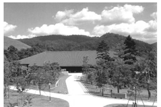
奈良県新公会堂 外観

■JR（関西本線・奈良線）「奈良駅」から奈良交通バス （市内循環）「大仏殿春日大社前」下車 東へ徒歩3分