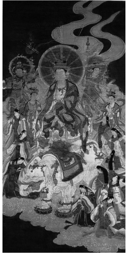
図1 普賢菩薩十羅刹女図 奈良国立博物館

息澄憲(一一二六―一二〇三)の表白であろう。『十二卷本表白集』の中の一例からは上西門院が母待賢門院(一一〇一―四五) (8) のためにとりおこなった追善供養の様がありありとみてとれる。この供養で女院女房達は意外な手段をとっている。一世代前に待賢門院自身が残した和歌の題に心をうたれて、それぞれが法華経の一品を書写しているのである。