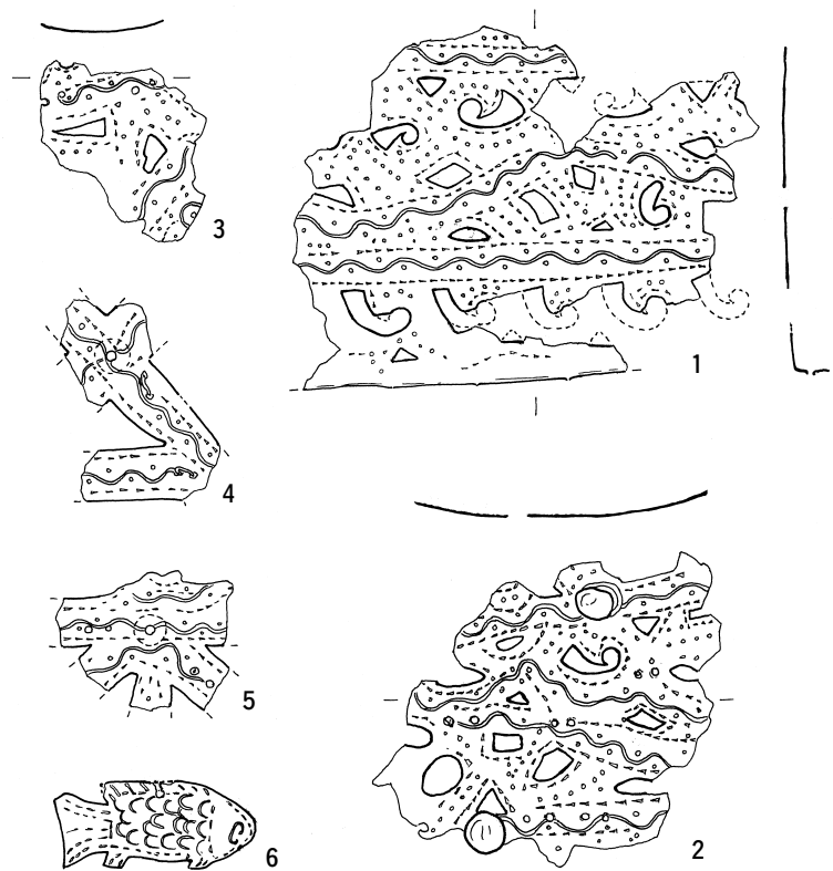
図2 十善の森古墳 出土金銅製透彫製品 2/3

片である。これには勾玉形、三角形、四角形などさまざまな透かしと蹴彫やポンチによる加工が一見無秩序に加えられているように見える。しかし、大きく見ると、折り返し部分と平行する波状列点文の帯とのあいだに勾玉文を一行に配し、それらの内側に（図では上側に）波状列点文が大きくうねりながら施されている幅の広い施文部があり、さらに、それを限る直線的な波状列点文の帯とが三層に重なっていることが読み取れる。つまり、二条のほぼ平行する波状列点文によって区画された中に主たる文様を配して、外側には勾玉文を連ねるといった構図になっていることがわかる。