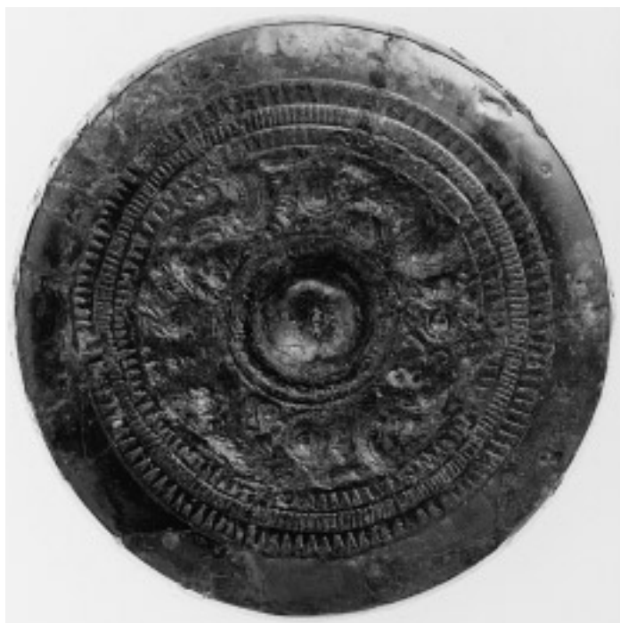
12 獸形鏡(13号鏡) (面径 13.4cm)