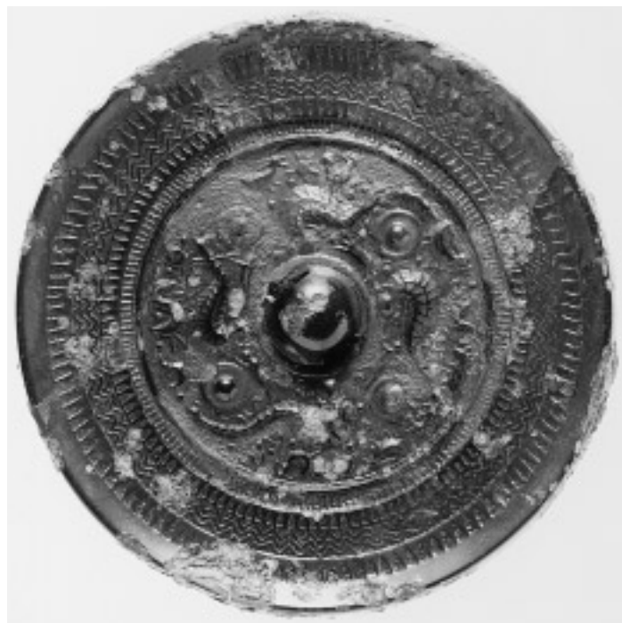
21 半三角縁人物鳥獸文鏡(22号鏡) (面径 15.1cm)