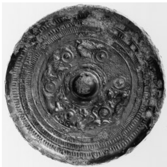
22 獸帯鏡(23号鏡) (面径 13.7cm)