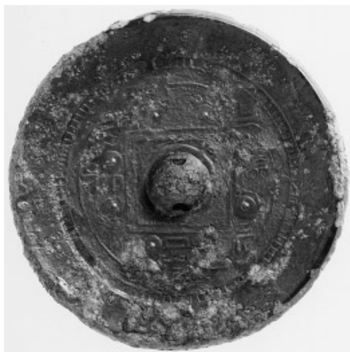
20 流雲文縁方格規矩鏡(21号鏡) (面径 13.9cm)