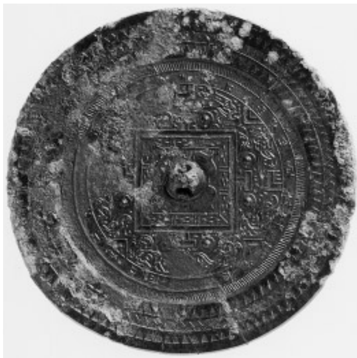
15 波文縁方格規矩鏡(16号鏡) (面径 16.1cm)