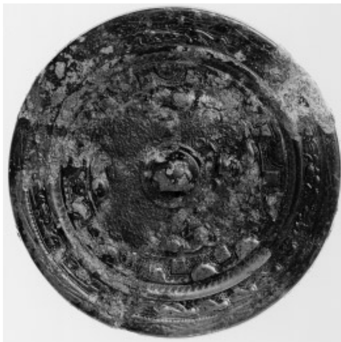
11 画文带神獸鏡(12号鏡) (面径 12.9cm)