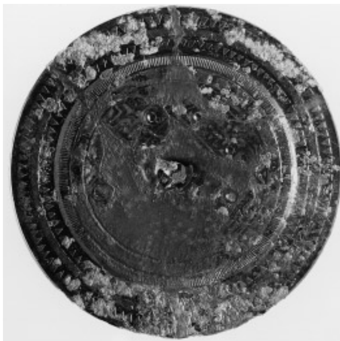
18 波文縁方格規矩鏡(19号鏡) (面径 15.8cm)