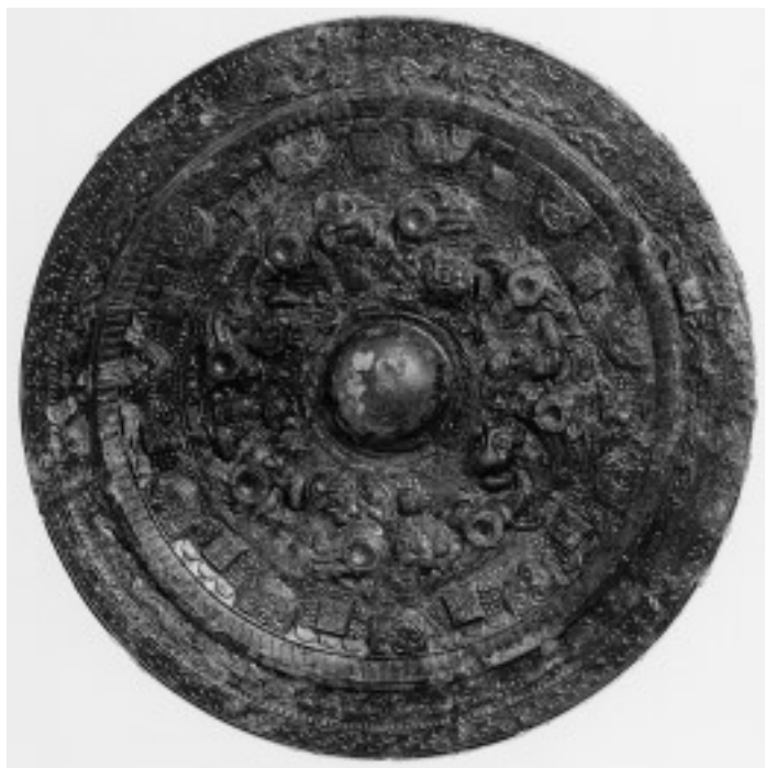
13 画文带神獸鏡(14号鏡) (面径 16.8cm)