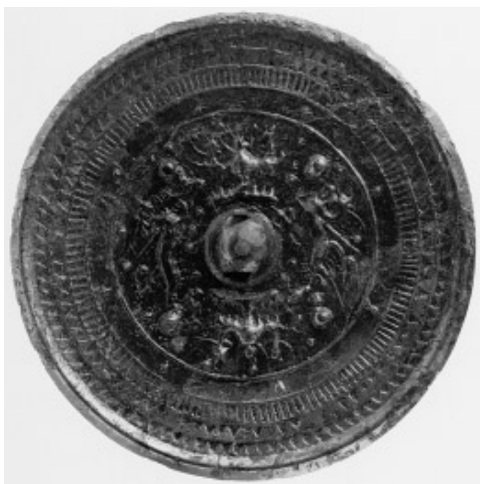
14 三角縁変形神獸鏡(15号鏡) (面径 17.4cm)