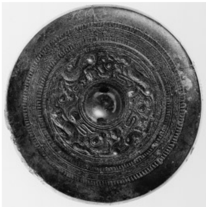
17 獸形鏡(18号鏡) (面径 18.3cm)