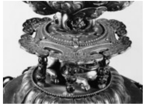
図11 金銅火焰宝珠形舍利容器 （華盤，輪宝，敷茄子部分）

この複雑な構成をまとめてみると、二重基壇と反花座の上に獅子があり、その上に五跣を茎とした華盤がのり、華盤の上には輪宝がとなり、さらに下方に獅子座がついた蓮華座に火焰宝珠がのっている。意匠に獅子や輪宝が見える点が金輪仏頂を彷彿させるが、この構成を金輪仏頂の道場観と比較してみると、次にあげる『別尊雑記』巻七「大仏頂法」（大正図像三・一一一）に説かれる大仏頂尊の道場観といくつかの共通点があることに気がつく（同書巻七裏書に「大仏頂はすなわち大日金輪なり」と見えるように、大日金輪を大仏頂と称することもある）。