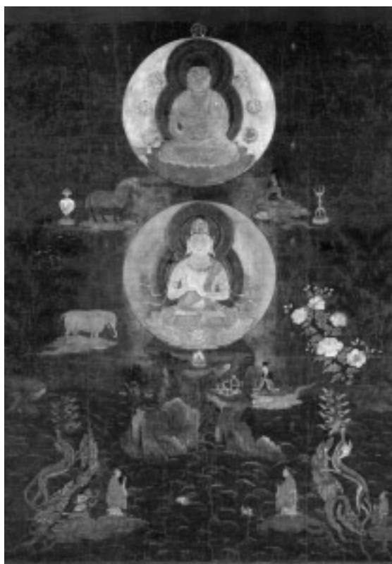
図13 大仏頂曼荼羅（奈良国立博物館）

また、金輪仏頂を描いた図像の一つ、大仏頂曼荼羅も唐時代にお ける舍利と金輪仏頂との関連を示す作品に数えることができる【図 13】。大仏頂曼荼羅は大仏頂法の本尊とされた曼荼羅で、画面中央 に波間から突き出た岩に坐す大日金輪を表わし、その上に釈迦金輪 を描いている（奈良国立博物館本（重文、平安時代）では大日金輪と釈迦 金輪を同じ大きさで表すが、『覚禅鈔』本など釈迦金輪をひとまわり小さく