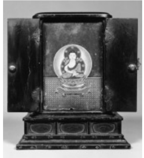
図5 宝篋印塔嵌装舍利厨子 (背面, 釈迦金輪像を表とした状態)