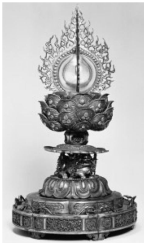
図9 金銅火焰宝珠形舍利容器(全景)

豪華な荘嚴の台座を有する火焰宝珠形舍利容器である。宝珠部分を水晶製とするほかは全て金銅製とし、台座の部分は細かいパーツに分けて作り、それを組み上げている。