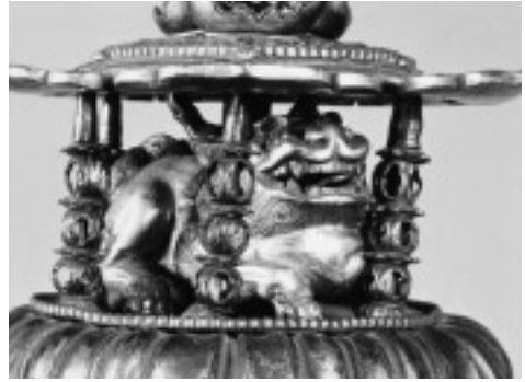
図10 金銅火焰宝珠形舍利容器（獅子部分）