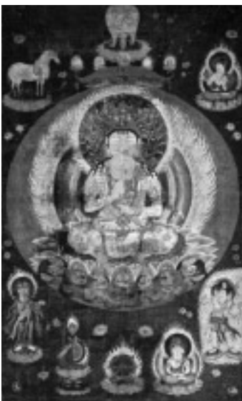
図1 一字金輪曼荼羅（重文、平安時代、奈良国立博物館）

右の引用文において注目される個所は二つある。まず一つは舍利がポロンに変じたことを説く部分で、この説に則り小野三流では舍利をポロンと自体と見なし、金輪仏頂を本尊とした舍利法が行われるようになったと考えられる。二つめは法身仏と応身仏との同等を述べた部分で、これは大日金輪と釈迦金輪という二種の金輪仏頂について説いたものと考えられる。すなわち、金輪仏頂には法身仏の大日金輪と応身仏の釈迦金輪がある。大日金輪は金剛界大日と同じく智拳印を結ぶ菩薩形で表わされる。蓮華座に結跏趺坐するが、座の下には伏した七頭あるいは一頭の獅子を表わす場合【図1】と、大日頂曼荼羅の大日金輪像のように獅子を表わさないものがある【図2】。釈迦金輪は定印を結び蓮華座に結跏趺坐する如来形であるが、頭上や体の周囲、印相の上などに輪宝を表わす点に特徴がある【図3】。