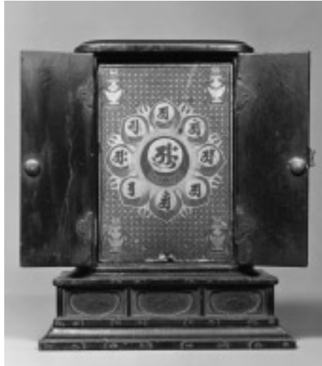
図6 宝篋印塔嵌装舍利厨子 (背面, 中台八葉院を表とした状態)