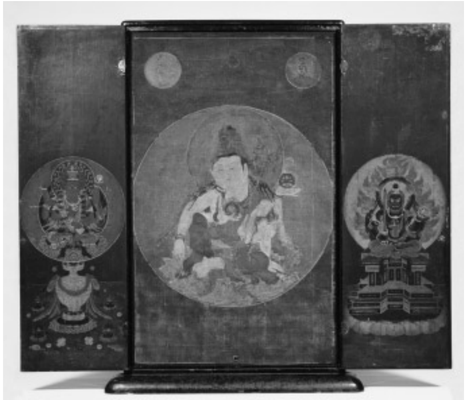
図8 大日金輪像（如意輪観音像を表とした状態）

輪宝が表わされる点など通常の大日金輪像には見ることのできない特徴を見ることができ、これときわめて近い図像に『大正新修大蔵経』図像第五卷（七七八頁）に掲載される「大日金輪」があり、このような形式の大日金輪像も存在したことがわかる。なお、像の四方には華瓶が描かれている。