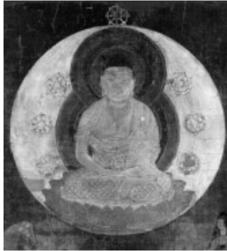
図3 釈迦金輪像(重文・大仏頂曼荼羅より、平安時代、奈良国立博物館)

は異なるが、『大陀羅尼末法中一字心呪経』において釈迦金輪と大日金輪との同等が説かれたことも、釈迦如来を法身仏の境地にまで高め、舍利を密教大系の中核に位置付けることを意図したものと考えることができよう。