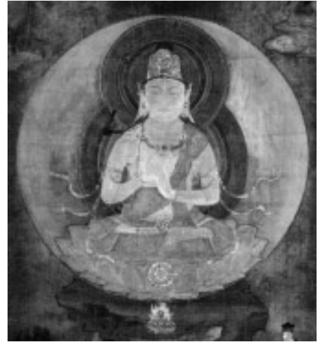
図2 大日金輪像(重文・大仏頂曼荼羅より、平安時代、奈良国立博物館)