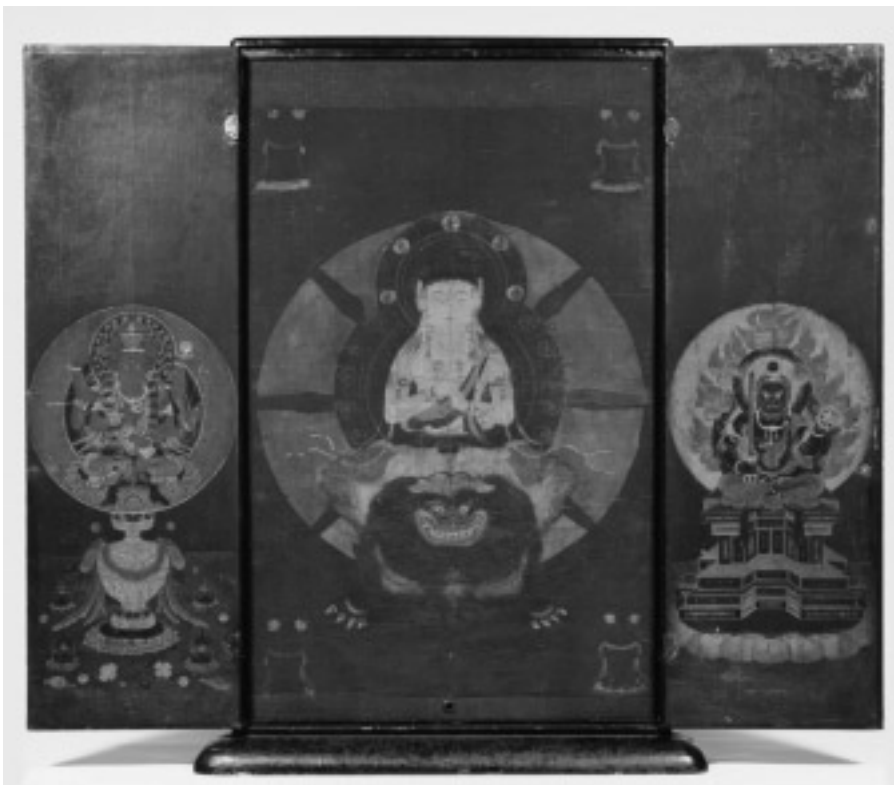
図7 大日金輪像(大日金輪像を表とした状態)

正面にのみ観音開き扉をもつけた、比較的大きな木製黒漆塗の薄型厨子である。扉をあけた奥には慳貪板があり、その一面には大日