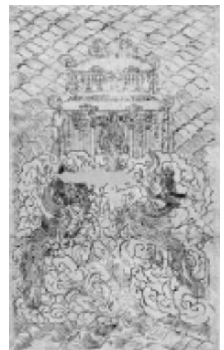
図14 摩尼宝珠曼荼羅 (重文、京都・仁和寺)

双龍については、『一字仏頂輪王経』巻一「画像法品」に説かれる龍王にあたるとする指摘があるが、問題は「画像法品」には金輪仏頂を圍繞する仏、菩薩、天王が数多く説かれており、双龍はそのうちの一要素にしかすぎないことである。あえて双龍だけを取りあげ、他は省略した点に大仏頂曼荼羅において双龍が重要な意味を有することがうかがえよう。この問題を考える際、注目されることは大仏頂曼荼羅とよく似た表現の双龍が、宝珠法の本尊である摩尼宝珠曼荼羅にも見られる点である【図14】。この曼荼羅は『如意宝珠転輪秘