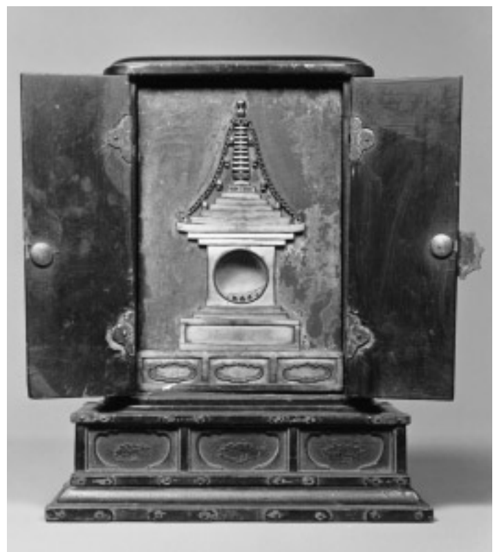
図4 宝篋印塔嵌装舍利厨子(正面)

この厨子では釈迦金輪像と中台八葉院(中尊は胎蔵界大日)が表裏 に位置し、さらにこの両者が舍利と表裏の関係にあるという複雑な