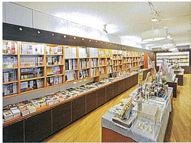
Corredor del sótano (Zona de entrada libre)