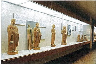
• Paneles ilustrativos y modelos de esculturas budistas