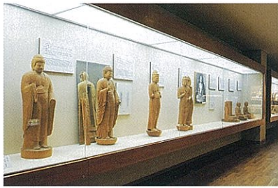
• 패널 전시, 불상 모형 등을 진열하고 있습니다.