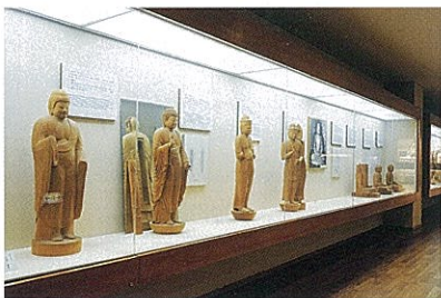
• Tafelanzeigen und Modelle von buddhistischen Skulpturen